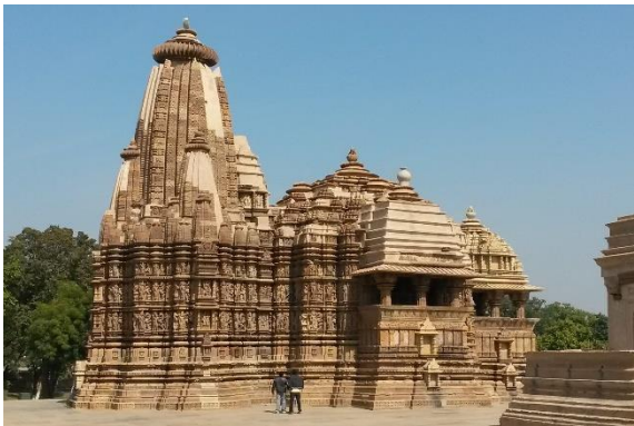
De Jagadambi tempel met de lagen van onwetendheid, de blokkades op weg naar verlichting.